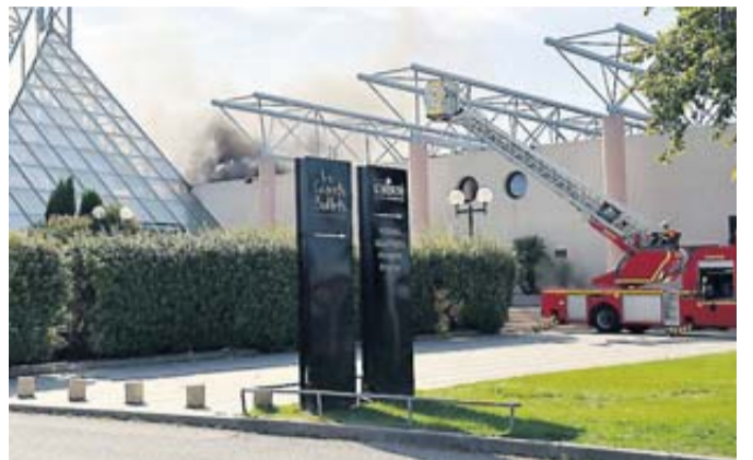
Le sinistre a généré un important panache de fumée.

10 heures, c'est l'horaire d'ouverture des bassins et piscines de l'Espace de liberté. Et dans les locaux des Grands Buffets, on s'activait en vue du service de midi. Il commençait donc à y avoir du monde sur le célèbre site de loisirs narbonnais, hier en milieu de matinée, lorsqu'un incendie s'est déclaré sur le toit du bâtiment. D'importants moyens ont été rapidement dépêchés sur place : trois engins pompes, deux grandes échelles, une quarantaine de pompiers, ainsi qu'un infirmier, deux ambulances et un véhicule d'assistance respiratoire pour prendre en charge d'éventuelles personnes blessées ou intoxiquées par les fumées. Fort heureusement, l'incendie n'a fait aucune victime, personnel et usagers présents sur place ayant été évacués (soit près de 200 personnes).