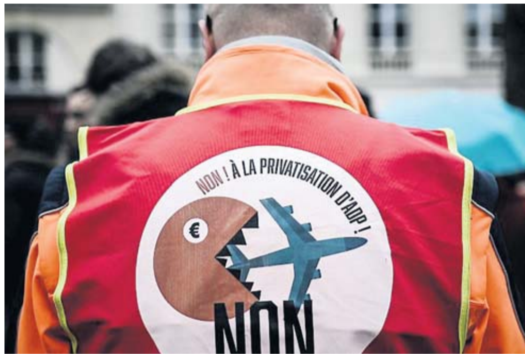
Il manque plus de 4 millions de signatures pour qu'un référendum ait, éventuellement, lieu.

Ainsi, le Conseil constitutionnel a comptabilisé, mardi dernier, 615 000 signatures en faveur du RIP. C'est 13 % de ce qu'exige la loi, afin qu'un tel référendum puisse, éventuellement, être organisé. La Constitution réglemente la procédure, créée en 2008 et jamais utilisée. Selon le texte, pour que les députés puissent discuter de l'organisation d'un RIP, 10 % des électeurs français doivent apposer leur signature. Aujourd'hui, cela représente 4,7 millions de personnes. Toutes les signatures doivent être réunies d'ici le 13 mars, six mois après que la pla-