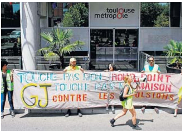
Les manifestants interpellent Toulouse Métropole devant le siège.

« On ne demande pas le luxe, on veut juste un hangar ». Devant le siège de Toulouse Métropole à Marengo hier, une vingtaine de personnes, gilet jaune sur le dos, expriment leur colère et leur incompréhension. Le 25 juillet dernier, le Tribunal d'Instance a ordonné l'évacuation sous huit jours de la « Maison du Peuple », un squat situé route de Paris à Fenouillet. Une expulsion justifiée par « les activités politiques et culturelles menées dans le