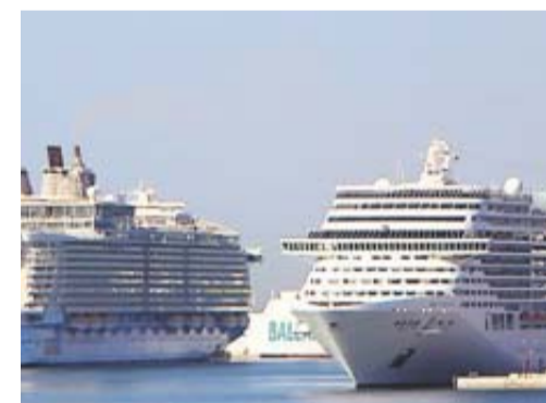
Des immeubles sur mer très polluants./

Les croisières sont en pleine expansion en Méditerranée. Dans les ports les plus fréquentés, comme aux Baléares, les riverains se plaignent. • page 4