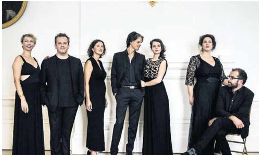
L'ensemble vocal et instrumental Contraste.

Une heure et demi de Toulouse par la route, le Festival du Comminges conjugue musique et patrimoine dans l'un des plus beaux sites d'Occitanie. Perché à 515 mètres d'altitude, au cœur de la commune de Saint-Bertrand-de-Comminges, la cathédrale Sainte-Marie domine les vestiges de l'ancienne ville romaine de Lugdunum Convenarum. Dans la plaine, la petite basilique Saint-Just de Valcabrère est un joyau de l'art roman. Les deux églises sont le berceau du festival créé en 1975 par Pierre Lacroix, industriel du Comminges passionné de musique. Présidé aujourd'hui par Francine Antona-Causse, placé sous la direction artistique du claveciniste et organiste Jean-Patrice Brosse, le Comminges maintient le cap de l'excellence. L'édition 2019, inaugurée le 20 juillet par l'Ensemble Occitania et Jean-Patrice Brosse, est placée sous le signe de l'Europe musicale. De Saint-Gaudens à Saint-Bertrand de Comminges,