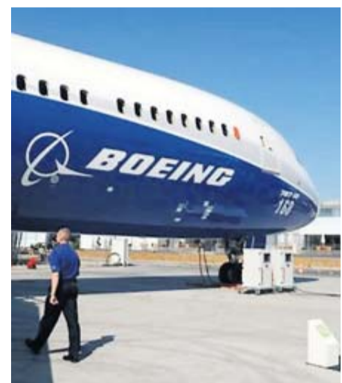
Tous les 737 MAX sont cloués au sol.

les qui l'ont été après le 13 mars mais qui n'ont pas reçu l'appareil. Southwest Airlines a annoncé la fermeture de sa base de New York-Newark, en raison de la pénurie d'avions dans sa flotte. Ryanair redoute une réduction de sa croissance. Air Canada s'attend à transporter moins de passagers au troisième trimestre en plein été. Boeing doit aussi se préparer aux procès intentés par les familles des victimes des deux accidents. Sans compter que sur le plan industriel, la situation est aussi critique. « Ils ne sont pas près de lancer leur avion de milieu de marché », annonce un spécialiste du secteur.