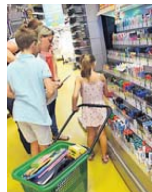
Une aide précieuse pour la rentrée scolaire.

L'Allocation de rentrée scolaire aide, sous condition de ressources, les familles à assumer les dépenses liées à la rentrée. Elle est versée par la Caf de la Haute-Garonne à compter du mardi 20 août. En 2018, plus de 55 000 familles en ont bénéficié, pour un montant total de 32 millions d'euros. Pour la rentrée 2019, l'Ars peut être versée pour chaque enfant scolarisé né entre le 16 septembre 2001 et le 31 décembre 2013, et pour chaque enfant plus jeune déjà inscrit en CP. Pour en bénéficier, les ressources de 2017 ne doivent pas dépasser les plafonds ci-dessous : pour 1 enfant, 24 697 € ; 2 enfants, 30 396 € ; 3 enfants, 36 095 € ; par enfant en plus, 5 699 €. Les montants : 6 - 10 ans : 368,84 € ; 11 - 14 ans : 389,19 € ; 3 enfants : 402,67 €. Pour les enfants âgés de 6 à 15 ans : le versement est automatique, si les familles remplissent les conditions. Pour les 16-18 ans, les familles doivent confirmer en ligne que leur enfant est toujours scolarisé, étudiant ou apprenti à la rentrée. Tout se fait dans l'espace Mon Compte ou sur l'appli mobile « Caf - Mon Compte ».