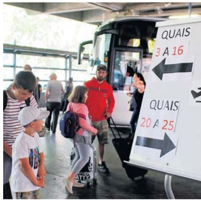
La signalétique fait partie des points à améliorer, selon les professionnels et les clients de la gare routière.