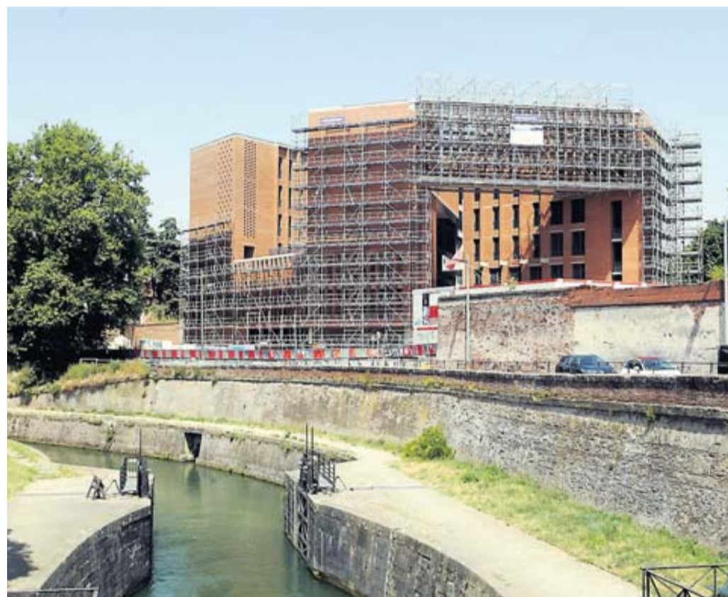
Au bord du canal de Brienne, la fin des perturbations liées au chantier de la Toulouse School of Economics n'est pas pour tout de suite, en tout cas pas avant 2021.

Si la nouvelle école d'économie de Toulouse doit être inaugurée en novembre, le parvis du bâtiment, à Saint-Pierre, ne sera fini au mieux que dans deux ans. Les riverains s'inquiètent.