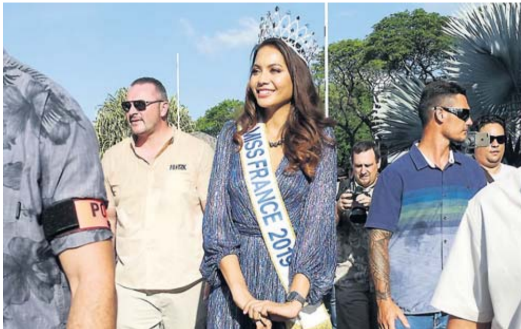
Vaimalama Chaves, la jeune Tahitienne élue Miss France 2019 s'apprête à illuminer la Fête des vins de Gaillac.

camion venant d'Espagne et immatriculé en Irlande, 344 kg d'herbe de cannabis. Le conducteur, mis en examen pour « importation, détention et transport de stupéfiants » a été placé en détention provisoire.