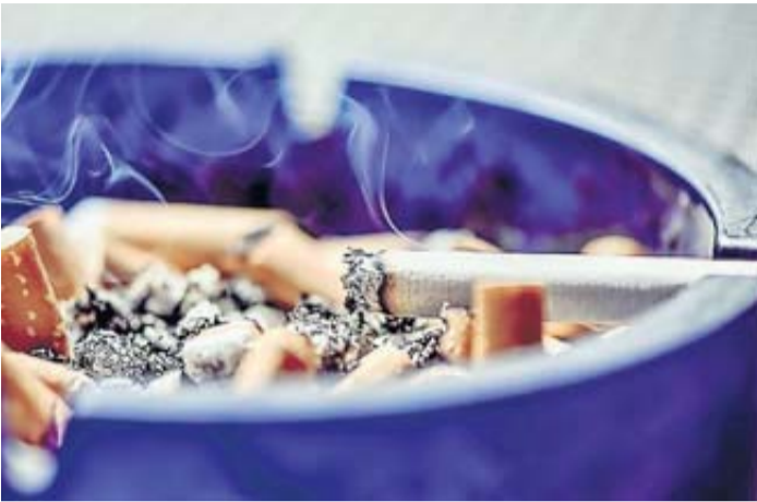
La police a alerté la population du danger sur les réseaux sociaux.

La cigarette tue. Mais elle implique aujourd'hui d'autres conséquences inattendues. Dans la Loire, un voleur a suivi pour la cinquième fois au moins le même mode opératoire. L'homme offre une cigarette à un jeune dans la rue ou dans un espace public. Après quelques bouffées, le jeune fumeur est pris d'un malaise tant l'effet de la drogue est intense. Il se retrouve même dans un état comateux. C'est à ce moment-là que son smartphone lui est dérobé, mais il ne s'en rend compte qu'à son réveil. Mardi après-midi, un cinquième adolescent a été victime de ce même piège, à Roanne dans la Loire.