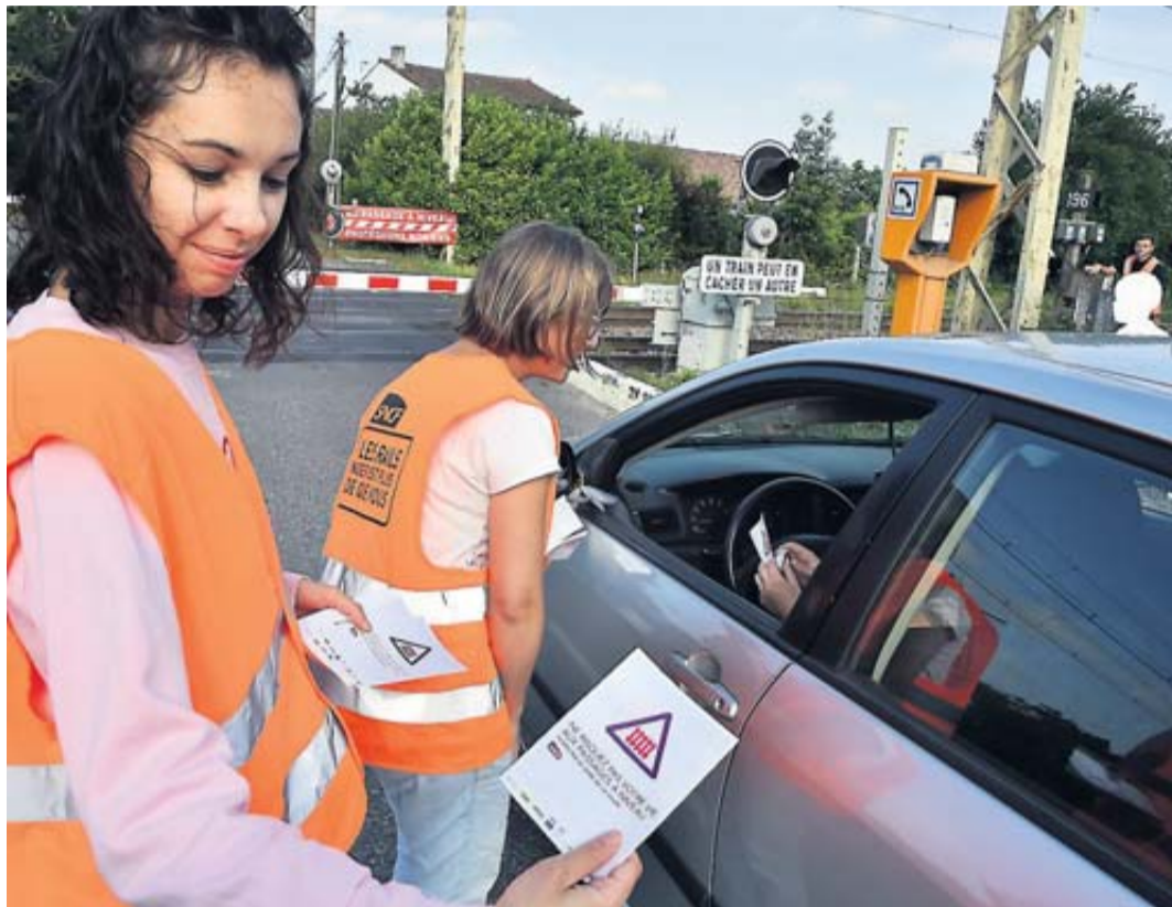
Lors d'une opération sécurité organisée par SNCF le 2 juin 2017 à ce passage à niveau, dangereux, qui doit être supprimé à l'horizon 2021.

L'Autorité environnementale (Ae) du Conseil général de l'Environnement et du Développement durable (CGEDD) donne des avis, rendus publics, sur les évaluations des impacts des grands projets sur l'environnement et propose des mesures visant à éviter, atténuer ou compenser ces impacts. Par exemple, sur un tracé d'autoroute ou d'une ligne TGV mais aussi sur un projet local. C'est ainsi que, lors de sa séance du 24 juillet dernier, l'Ae s'est intéressée à la suppression du passage à niveau n° 196 (PN 196), à Escalquens, après avoir statué, entre autres, sur l'extension du Terminal 1 de l'aéroport de Marseille ou sur une usine d'éoliennes en mer au Havre. L'Ae est composée de 15 personnes qualifiées dont 9 sont issues du CGEDD et 6 sont des personnalités qualifiées externes, choisies pour leur compétence en environnement. Elle a donné un avis sans concession sur ce projet haut-garonnais conduit en partenariat par le Conseil départemental, la mairie d'Escalquens et le Sicoval, SNCF (Réseau Ferré de France) et la Région. Le projet de suppression du PN 196, situé sur la ligne ferroviaire Toulouse-Sète à Escalquens, consiste en la création d'une voie nouvelle et de deux giratoires, le franchissement de la voie ferrée se faisant par un pont-route légèrement au nord