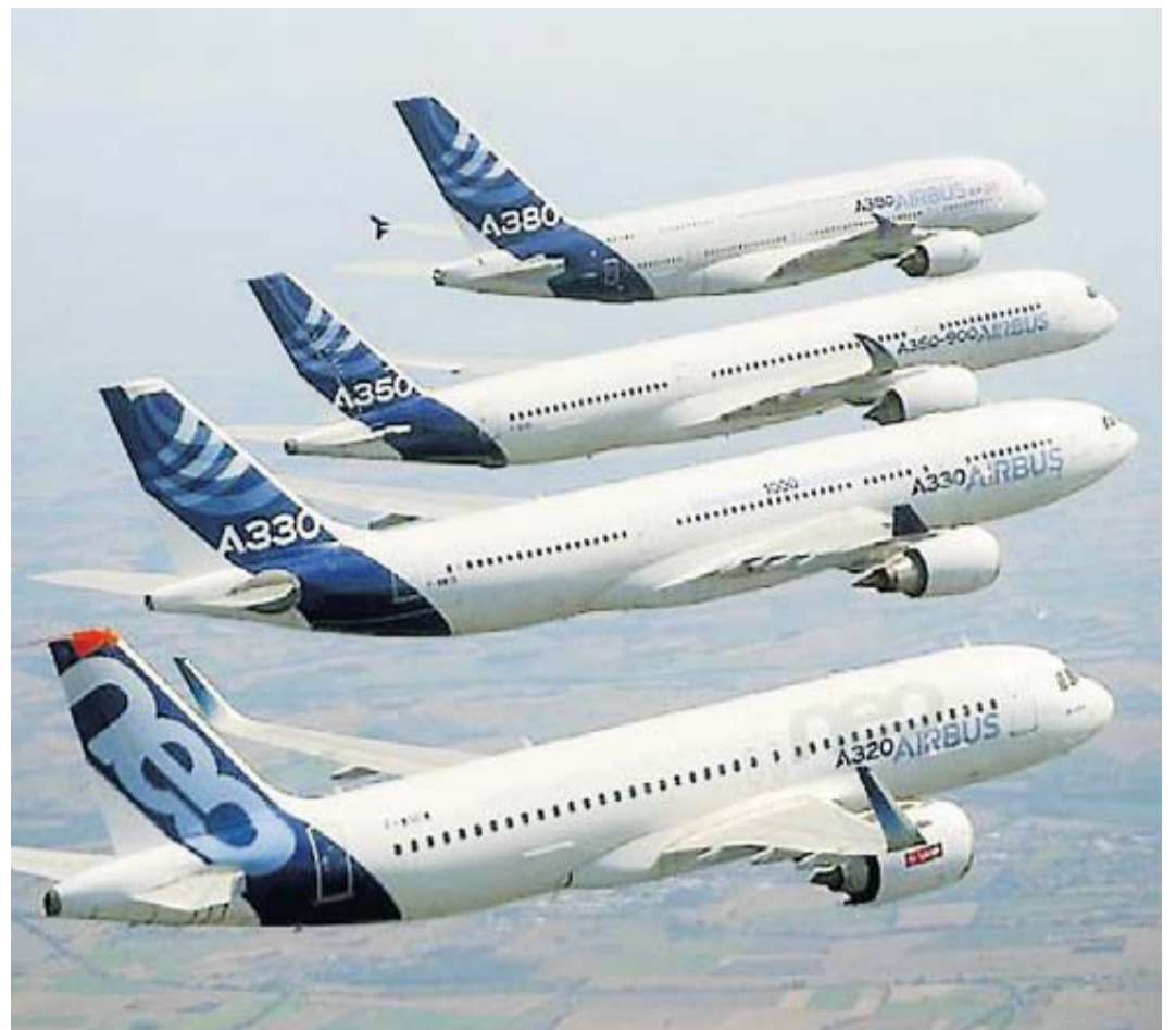
Malgré l'échec de l'A380, assemblé à Blagnac, Airbus possède dans son catalogue d'avions quelques modèles au succès retentissant, tel que l'A320.