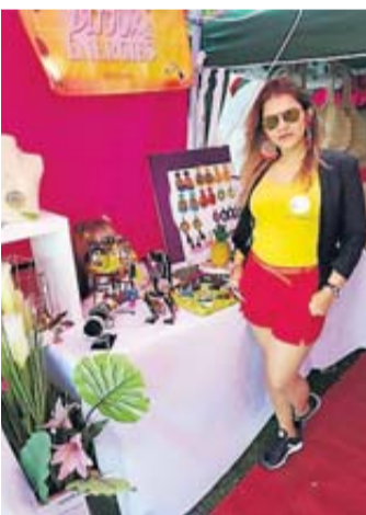
Chamila réalise toute une gamme d'objets en raphia.

Chamila donnera d'ailleurs un gala humanitaire au mois d'octobre à Toulouse au profit de cette cause.