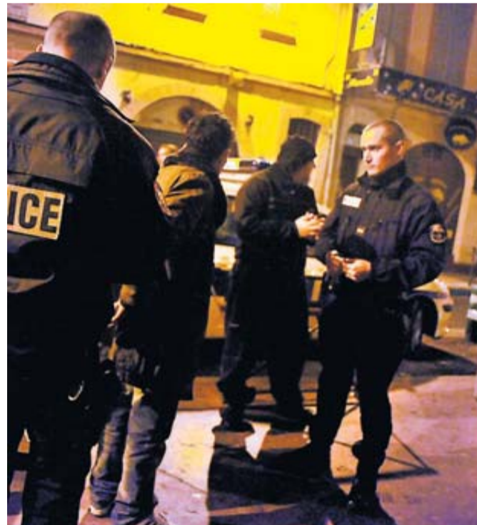
L'octogénaire a été frappée sur la place de l'Europe, à Toulouse.

Les deux suspects ont été interpellés à peine une demi-heure après les faits.