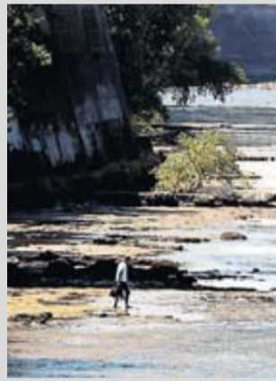
La Garonne tient le choc.

Le cinquième comité de l'eau de l'année s'est réuni cette semaine pour faire le point sur la situation hydrologique dans le département de la Haute-Garonne. Premier constat, un répit a été accordé par les pluies du week-end dernier alors que le tarissement des cours d'eau commençait à s'accélérer, y compris sur les grands cours d'eau du département. Les petits cours d'eau non réalimentés présentaient aussi des débits assez faibles voire des assècs. Les débits des cours d'eau réalimentés, notamment la Garonne, sont stabilisés grâce aux lâchers d'eau depuis les retenues et barrages qui présentent encore un niveau de remplissage satisfaisant à ce stade de l'étiage. Au vu des prévisions météorologiques qui n'annoncent pas de précipitations significatives à court terme, la vigilance reste de mise et une attention particulière doit être portée sur la consommation en eau de chacun des usagers. Et la situation hydrologique amène à maintenir les restrictions en place.