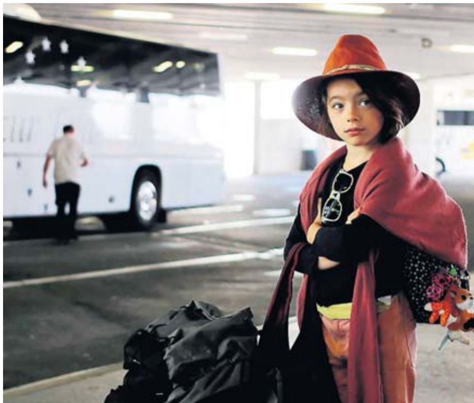
Une jeune baroudeuse en transit hier à la gare routière de Toulouse.