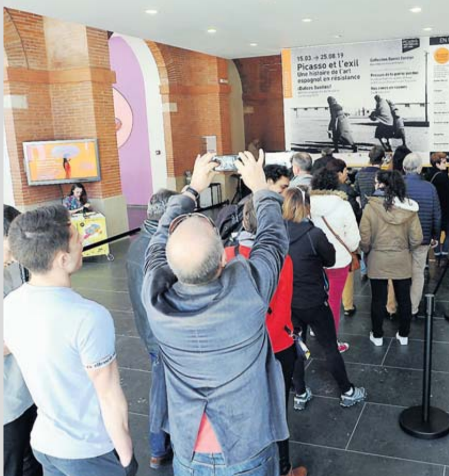
Le musée des Abattoirs draine un nombreux public.