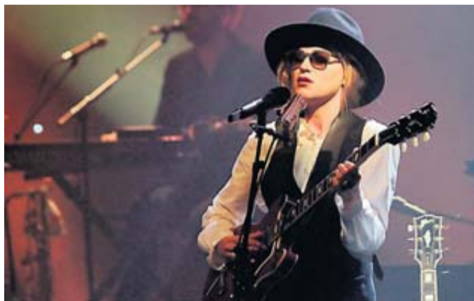
Melody Gardot, envoûtante et mystérieuse, vendredi soir.

Avis à ceux qui n'auraient pas eu la chance d'être à Marciac vendredi, le spectacle « Confidences in Marciac » remetra le couvert samedi et dimanche à 17 h. À 21 h vendredi, les festivaliers se presseront vers le chapiteau pour écouter la « diva bohème », Melody Gardot . Rare sont ceux qui ont réussi à percer le mystère dont s'entoure la chanteuse. Derrière ses lunettes fumées, chaque fois la grâce s'exprime. Elle fait partie avec Diana Krall et Norah Jones d'un cercle fer-