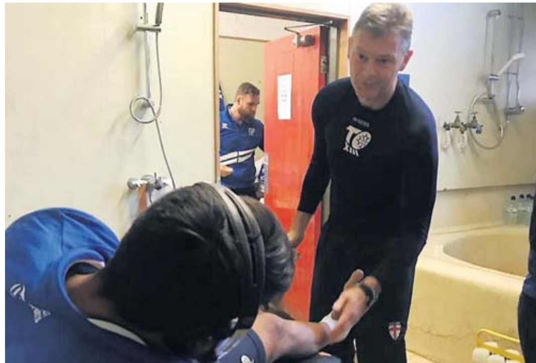
Outre-Manche, il est aux petits soins pour les Toulousains.