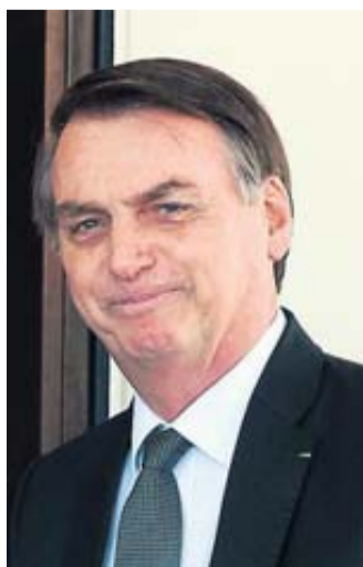
Il était chez le coiffeur.

Aller chez son coiffeur plutôt que de rencontrer le ministre français des Affaires étrangères, Jean-Yves Le Drian. C'est ce qu'a fait Jair Bolsonaro, Président du Brésil, lundi dernier. Les deux hommes devaient se rencontrer, à Brasilia. Jean-Yves Le Drian passait dans la ville brésilienne, au cours de sa traversée de l'Amérique du Sud. Jair Bolsonaro a annulé la rencontre « pour des raisons d'agenda ». Quelques minutes après, le Président du Brésil s'est montré, sur Facebook, en train de se faire couper les cheveux. Le porte-parole du gouvernement brésilien explique