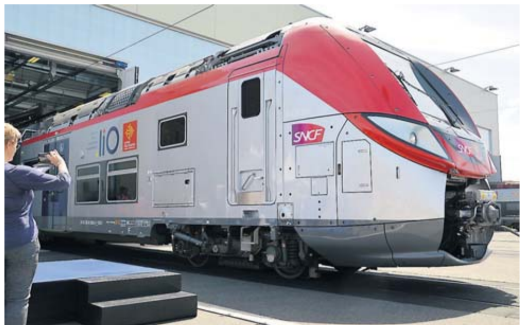
18 nouvelles rames de train nouvelle génération sont désormais en service dans la région.