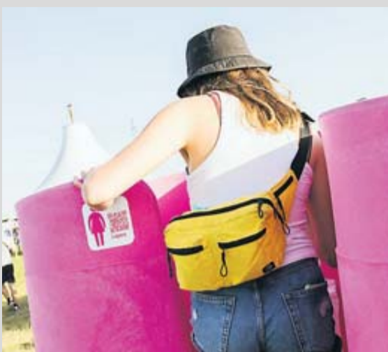
Les Lapee sont commercialisés en France par une entreprise de Colomiers.

« Lapee est plus hygiénique, on ne touche pas de porte