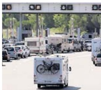
Vendredi 2 août est classé orange au niveau national.

Ce samedi 3 août sera la journée la plus difficile de l'été sur l'ensemble des grands axes de liaison du pays. Il correspond au chassé-croisé entre les « juilletistes » et les « aoûtistes ». La circulation sera « extrêmement difficile » sur la grande majorité des axes routiers. À noter que durant tout le week-end, dans le sens des retours, la circulation sera dense et bien souvent difficile sur l'arc méditerranéen entre l'Italie et l'Espagne, que ce soit en sens Est-Ouest ou en sens Ouest-Est sur les autoroutes A7, A8 et A9. Des difficultés particulières sont attendues sur l'A10 à hauteur de Bordeaux pour les trois jours.