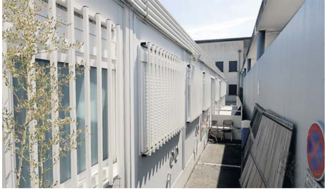
En 2015, les parents d'élèves s'étaient mobilisés contre la vétusté des locaux. Cette année, ils sont en colère contre la mairie, qui avait promis un agrandissement de l'école, avant de se rétracter.

L'adjointe au maire en charge de l'Education, Marion Lalane de Laubadère, répondait : « Nous allons construire deux nouvelles cantines, pour la maternelle et l'élémentaire, et l'actuelle cantine sera transformée en salles de classe. Les salles en préfabriqué disparaîtront. La livraison se fera en 2019. » Quatre ans après, si les classes ont bien été transférées dans l'ancienne cantine, la nouvelle