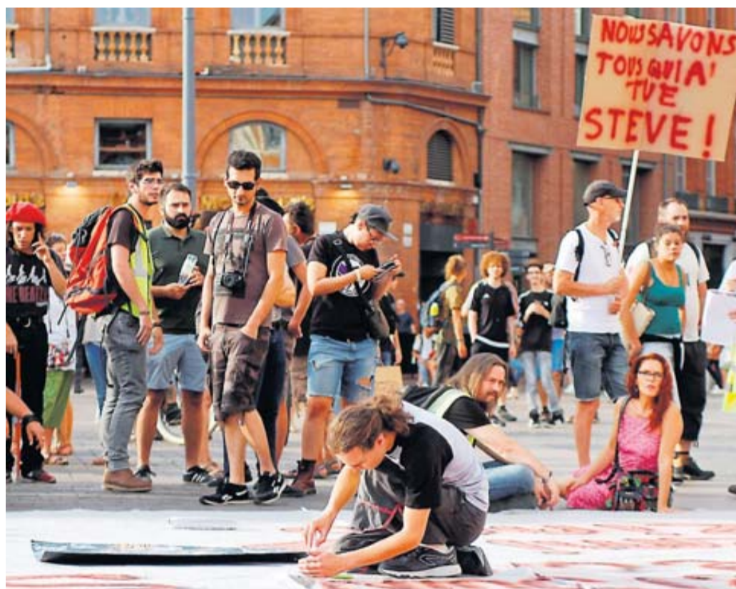
Place du Capitole, les participants ont peint et déployé une banderole à l'issue du rassemblement.