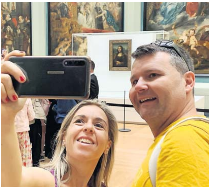
Au fond La Joconde, mais les yeux regardent l'objectif et pas le tableau.

« Vous imaginez aller à New York sans aller voir la statue de la Liberté ? » Cette remarque d'un Japonais venu d'Osaka pour visiter Paris résume à elle seule l'engouement des touristes pour la Joconde. Parmi les 10,2 millions de visiteurs accueillis par le Louvre en 2018 (record de fréquentation), 80 % sont venus voir en priorité le tableau de Léonard de Vinci ! Un succès grandissant qui ne va pas sans poser de problèmes pour la régulation du trafic à l'intérieur du musée. D'autant plus cet été, car des travaux de rénovation sont entrepris dans la salle des Etats ( lire encadré ) qui accueille habituellement la Joconde. Déplacée dans la galerie de Médicis, au second étage de l'aile Richelieu, la Joconde se mérite plus que jamais. Pour la trouver, il suffit de s'arrimer à l'immense file d'attente. Pour diriger au mieux les visiteurs et ne pas encombrer le musée, dont le hall est rapidement saturé, le Louvre a embauché spécialement une trentaine d'agents dédiés à la seule fluidification de la foule. « Une opération indispensable, d'autant plus que la fermeture de Notre-Dame renvoie chez nous des visiteurs supplémentaires » explique une chargée de communication. Depuis le 16 juillet, date du déménagement de la Joconde, le musée a ainsi testé plusieurs dispositifs de circulation afin de rendre la visite la plus confortable possible. Bien que les billets ne soient plus vendus sur place mais uniquement sur