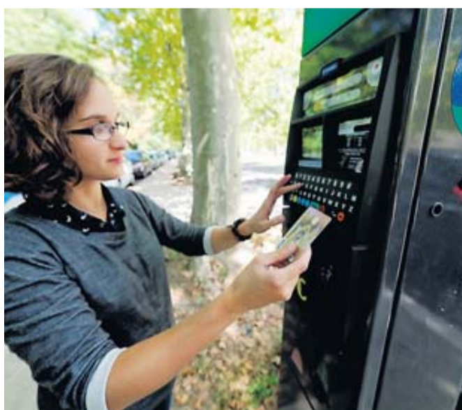
Pas besoin de payer pour se garer aujourd'hui.