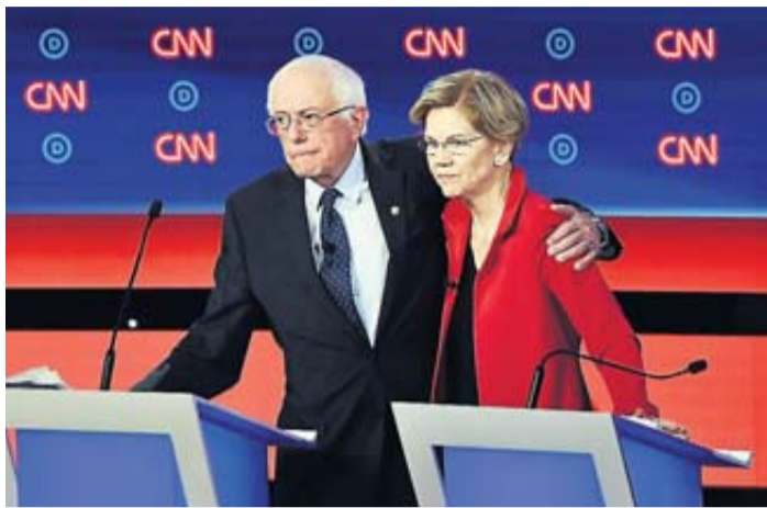
Les deux sénateurs, soutenus chacun par environ 15 % des électeurs démocrates, ont été attaqués sur leurs positions par leurs rivaux.

Pour battre le président sortant Donald Trump, les démocrates devront-ils propulser un candidat jugé « consensuel » ? C'est en tout cas autour de cette question que les échanges ont été rythmés lors du débat qui s'est déroulé mardi soir (heures locales) sur la chaîne CNN entre prétendants à l'investiture pour la présidentielle de 2020. Alors que 10 des 25 candidats étaient réunis pour débattre dans un théâtre de Détroit (dans le nord des États-Unis), les sénateurs Bernie Sanders et Elizabeth Warren ont ainsi été vivement attaqués par leurs concurrents modérés. Une situation qui a révélé des lignes de fracture idéologiques au sein du parti, entre une aile gauche et une frange centriste. Les deux figures marquées à gauche ont dé-