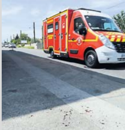
Les faits se sont déroulés devant de nombreux témoins.

Tout serait parti d'une banale « embrouille » au volant. Mais la situation a complètement dégénéré avant de virer à l'altercation à l'arme blanche. Hier, une scène surréaliste s'est nouée à Labarthe-sur-Lèze, au sud-ouest de Toulouse. Peu après 14 heures, une violente rixe opposant quatre individus a eu lieu aux abords de la route départementale 19, sous les yeux de nombreux automobilistes éberlués. Deux individus s'en sont violemment pris à un quinquagénaire et un jeune homme qui ont été blessés par des coups de couteau. L'un d'eux a été plus grièvement atteint à une épaule et souffre d'une fracture de la mâchoire. Ce qui a contraint les sapeurs-pompiers et les équipes du Samu 31 à le transporter à l'hôpital. « Personne ne va mourir », rassure