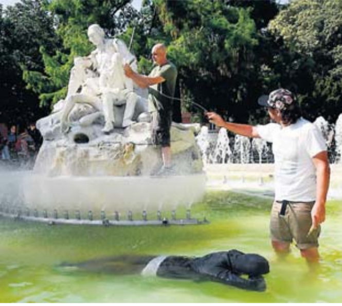
Le pêcheur et le noyé, deux sculptures signées Mark Jenkins qui, durant deux jours, ont orné la fontaine Goudouli.