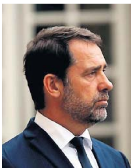
Le ministre de l'Intérieur semble fragilisé