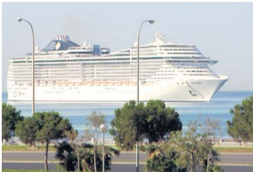
L'Oasis of the Seas est l'un des plus gros paquebots du monde.

Ce jour-là, quatre bateaux passent la journée dans le port de Palma. Parmi eux, l'un des plus grands au monde, l'Oasis of the Seas et ses 8 000 personnes à bord. Trois cents bateaux sont ainsi attendus cet été, deux fois plus qu'il y a dix ans. Dans un rapport publié récemment, l'ONG Transport & Environnement a dénoncé la pollution engendrée par les bateaux de croisière, une activité en plein développement avec 7 millions de passagers en 2018 et 20 milliards d'euros de