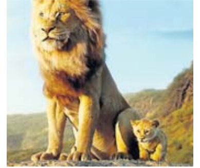
« Le roi lion ».

Le dessin animé initial avait réuni plus de 10 millions de spectateurs en France, en 1994. La nouvelle version du « Roi Lion », prouesse technologique associant prises de vues réelles et images numériques, devrait faire encore mieux. Le film de Jon Favreau a déjà dépassé les 5,6 millions d'entrées en deux semaines, dopant un été habituellement bien plus calme dans les cinémas. A Toulouse et dans l'agglomération, le « Roi Lion » avait réalisé 54 000 entrées en première. Il rugit encore en deuxième avec 47 000 spectateurs, ce qui dénote un excellent bouche-à-oreille. Visiblement, le public familial est épaté par un film à la fois attendrissant et spectaculaire qu'il découvre comme au premier jour... beaucoup d'enfants n'ayant pas vu la version d'il y a 25 ans. Avec d'autres succès comme « Toy Story 4 » et le nouveau « Spider-Man », les Américains règnent en maître sur le box-office qui a dépassé les 100 000 entrées, la semaine dernière, à Toulouse et autour. Malgré un cinéma français à la traîne avec un thriller, « Anna », et deux comédies, « Le premier de la classe » et « Ibiza », qui font pâle figure.